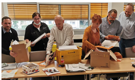
Mitglieder des Landesvorstandes packen die Willkommensmappen für die Werbung neuer Mitglieder.

Ein weiteres Thema der Sitzung war die Mitgliederaktion des vlbs. Hierzu wurden entsprechende Willkommensmappen mit jeweils neun Einzelteilen bestückt und versandfertig gemacht.