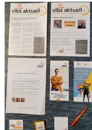
Der Inhalt der Willkommensmappen, bestehend aus Anschreiben, Anmeldeflyer, Flyer dbb-Vorteilswelt, Juni- und Septemerausgabe von vlbs-aktuell, Kugelschreiber, Notizklotz, Chip für Einkaufswagen und einem Täfelchen Schokolade