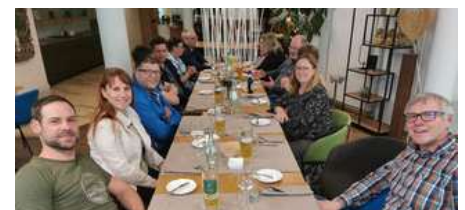
BV Mitglieder beim gemeinsamen Essen im Nells Park Hotel Trier.

Der vlbs möchte an dieser Stelle gerne seinen Dank für die langjährige Unterstützung aussprechen.